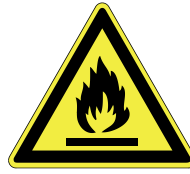
Warnung vor feuergefährl. Stoffen