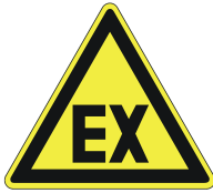
Warnung vor explosionsfähiger Atmosphäre