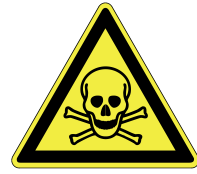
Warnung vor giftigen Stoffen

Allgemeine Gefahrstel- len werden wie folgt beschildert: