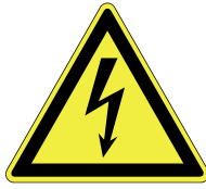
Warnung vor elektrischer Spannung